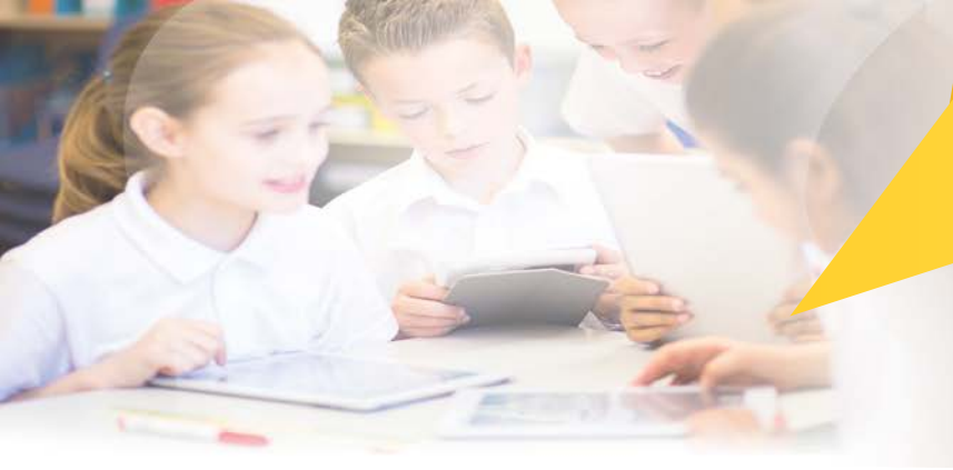
Tableau comparatif Classe mobile