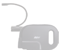
▶ Visualiseurs USB U50 / U70+