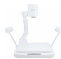
▶ Visualiseurs plateforme PL50