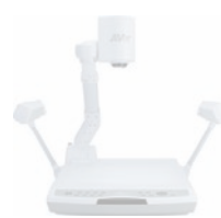
▶ Visualiseurs plateforme PL50