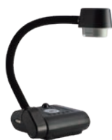
▶ Visualiseurs à bras flexible F17-8M / F50-8M / F70W